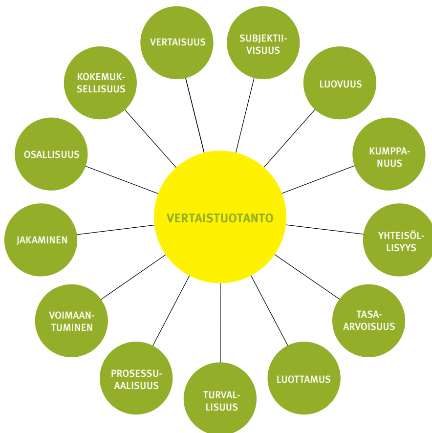
KUVA 1 Vertaistuotantoon linkittyviä käsitteitä.

Vertaistuotannon paikasta ja roolista yhteiskunnassa ei ole yksiselitteistä käsitystä. Mielipiteet ja -kuvat vaihtelevat eri tieteenaloilla ja yksilöittäin. Sektoriajattelussa (yksityinen, julkinen, kolmas sektori) vertaistuotannosta puhutaan usein ”neljäntenä sektorina”. Tämä luo mielikuvia toissijaisesta toiminnasta ja herättää myös vastaväitteitä: ”vertaistuotanto ei ole sektori eikä se ole neljäs”.